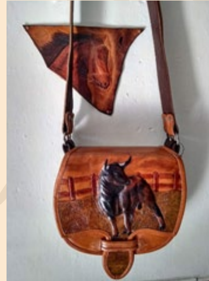
Carriel Toro, acabado café (7 bolsillos visibles y 3 ocultos) $585.000