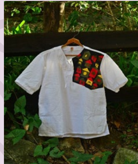
Camisa Colonial: $117.000