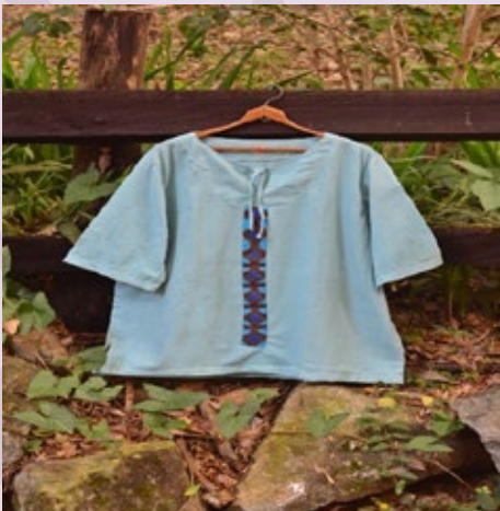
Camisa Rustica: $91.000