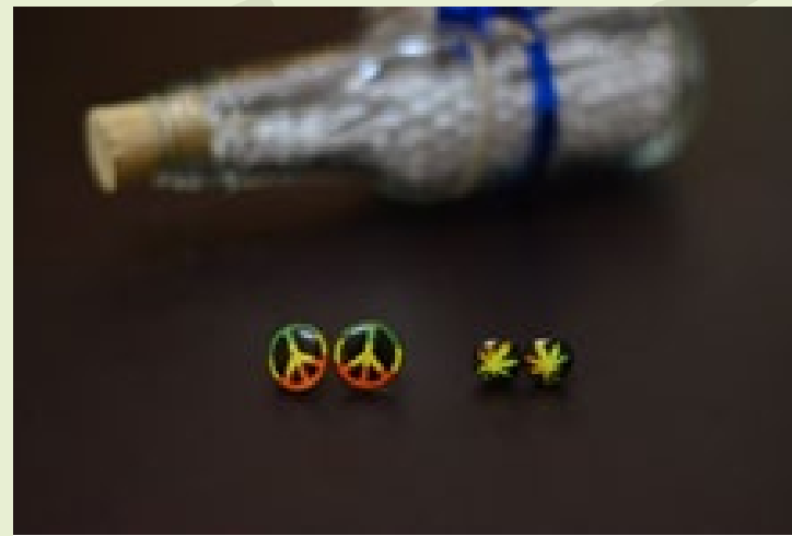
Aretas mandala: $3.900