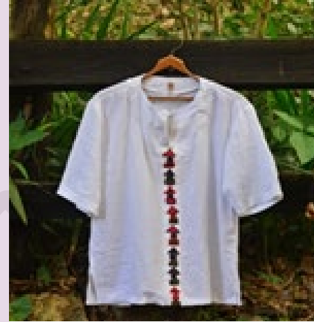
Camisa Casitas Tribales: $117.000