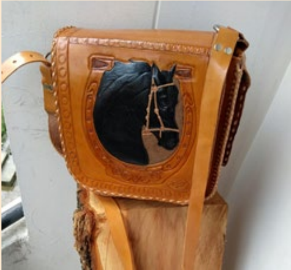
Bolso Caballo Negro: $325.000