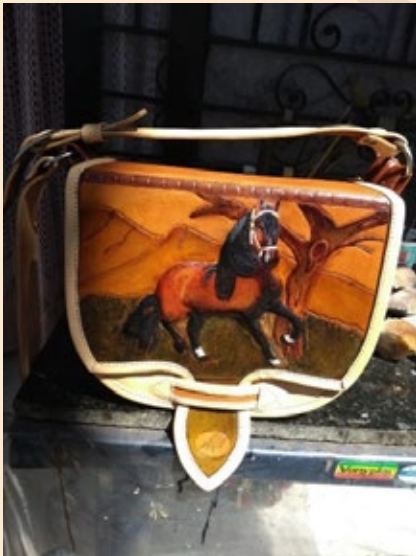
Carriel Caballo, acabado beige (7 bolsillos visibles y 3 ocultos): $585.000