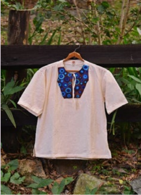
Camisa Índigo: $117.000