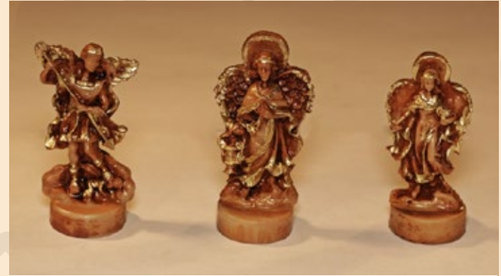
Tres arcángeles: $15.600